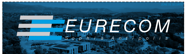
LOGO EURECOM HORIZONTAL