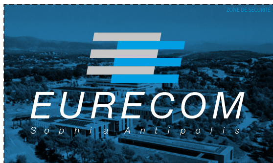
LOGO EURECOM VERTICAL